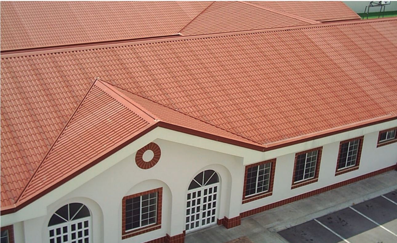
Cumple con las normas: ASTM E1646 & E 1680, ASTM C1363, ASTM E1592.